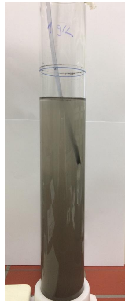
nach 2 h